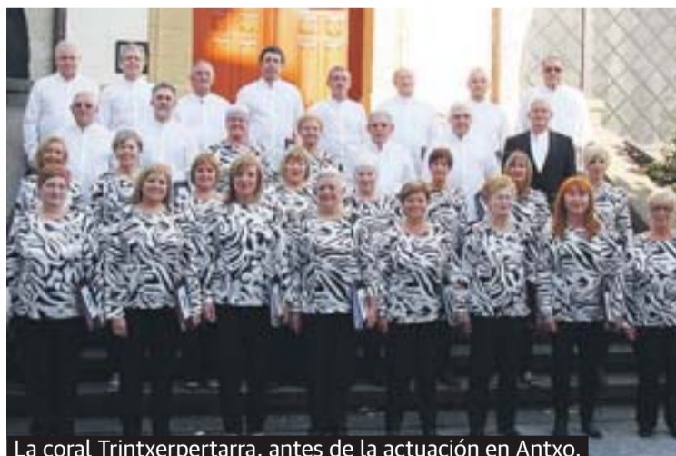
La coral Trintxerpertarra, antes de la actuación en Antxo.

Recuerdan, además, al PNV que la ciudadanía tiene muy claro qué es lo que quiere para su futuro en La Herrera y que no coincide con sus intereses.