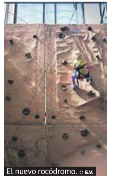
El nuevo rocódromo.

El Palacio Arizabalo será escenario esta tarde de un nuevo encuentro ciudadano en el que la alcaldesa, Amaia Agirregabiria, acompañada de varios miembros del equipo de Gobierno, informará a la ciudadanía sobre el sistema de recogida de residuos conocido popularmente como puerta a puerta, que quiere implantarse en Pasaia. La cita se anuncia a partir de las 19.30 horas, en el salón de plenos. El encuentro se repetirá la próxima semana en Antxo y Trintxerpe.